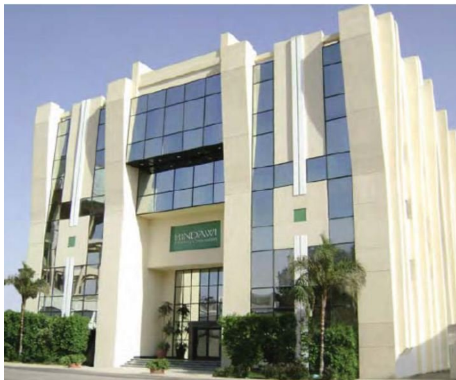
خانه‌ای از هرزنامه (Spam): دفتر هینداوی در قاهره، مصر

شرکت انتشارات هینداوی ۱ یکی از بزرگترین ناشرین علمی و یکی از سودآورترین آن‌ها می‌باشد.