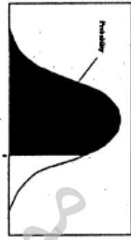
سطح زیر منحنی نرمال استاندارد