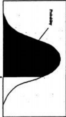
منبع زیر منحنی نرمال استاندارد